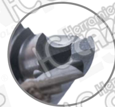
Punta SPLIT POINT