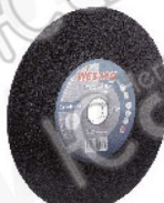
Disco Abrasivo Z-20400 (1 malla) Z-20410 (2 mallas)